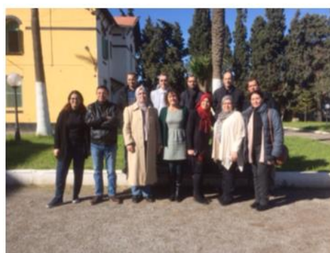
Groupe de formateurs Alertes SA Aïn Témouchent – Janvier 2018

Fin 2018, environ 60 % des activités prévues ont été réalisées. Ce projet se terminera en novembre 2019.