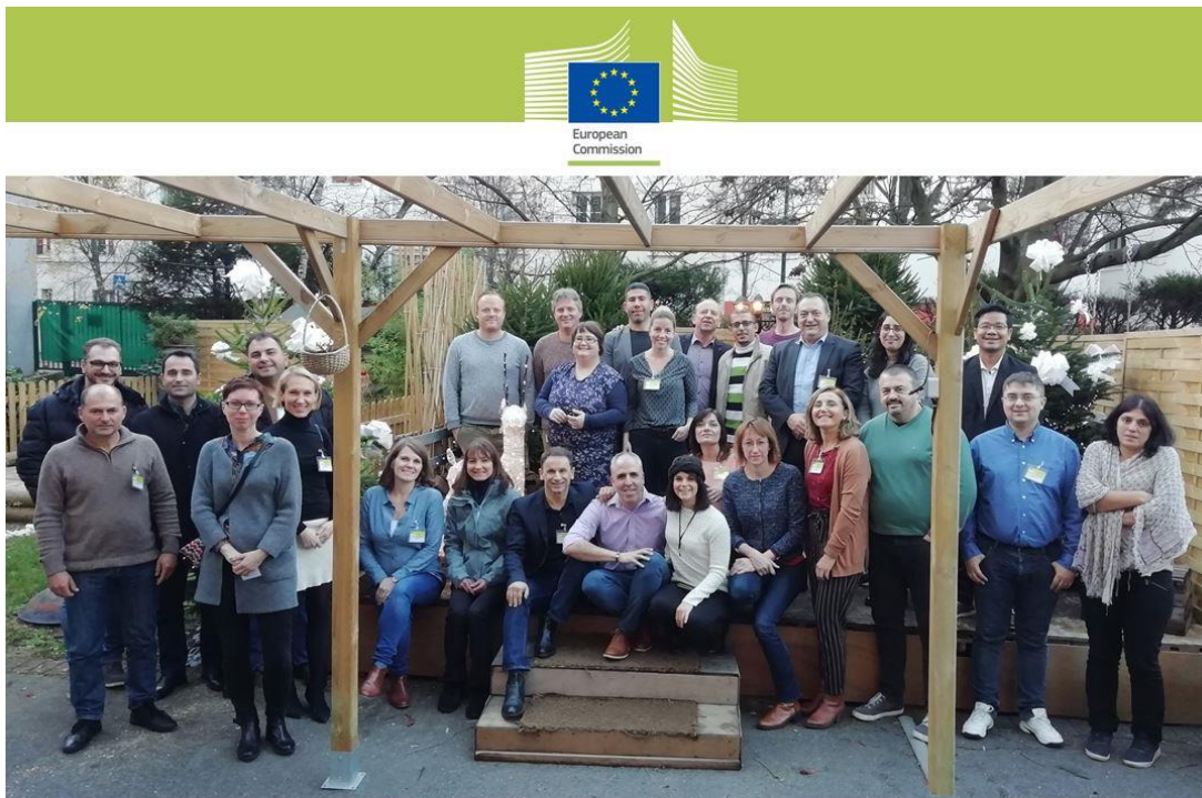
BTSF on the HACCP Principles Developed by Food Business Operators Session 6 – Paris, France, 10 – 14 December 2018

6 BTSF en cours (Feed, HACCP, PIF, World aquaculture, microbiologie, ESB et EBP) ont donné lieu à Ces BTSF ont donné lieu à 24 missions de formation des experts FVI dans plusieurs pays : Lituanie, Portugal, République Tchèque, Hongrie, ou encore Vietnam pour le BTSF World.